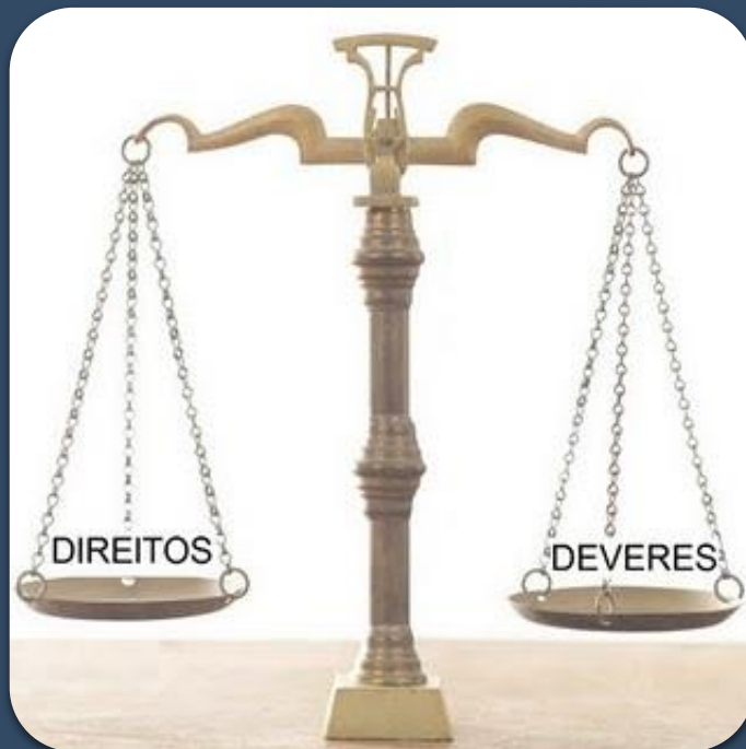
Direitos x Deveres